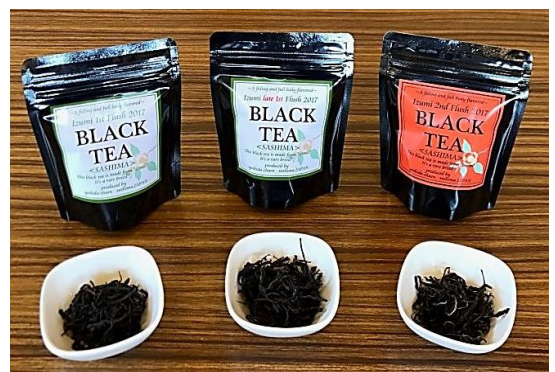
3種どれも 20g入 ¥1,000(税込¥1,080)

写真右: おかげさまで当園の紅茶も多くの方々から「おいしい」と好評いただき、さらにこの度、茶期別の紅茶をご用意いたしました。 ・1st flush/・late1st/・2nd/の3種です。 ダージリンに近い味わいの1st, late1stはまるで中国茶のように淹れ方や飲み方によってさまざまな味わいが楽しめます。2ndは南洋の花を連想させる甘い香りと爽やかな後味が楽しめます。