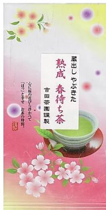
100g ¥1,000 (税込¥1,080)

すっかり春の定番となりました『熟成 春待ち茶』蔵出し・販売は年明け1月中旬からとなります。低温熟成により、お茶それぞれの味が仲良く手をつなぎ、まるやかでやさしい味わいになります。