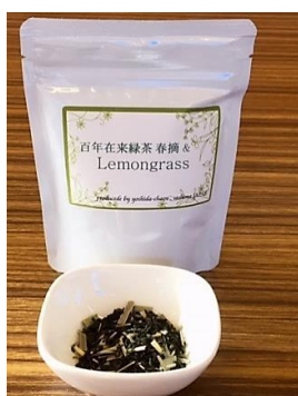
どちらも 35g入 ¥650(税込¥702)